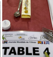
Repas de gala