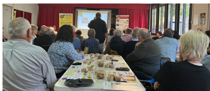
Afterwork « instants partagés »